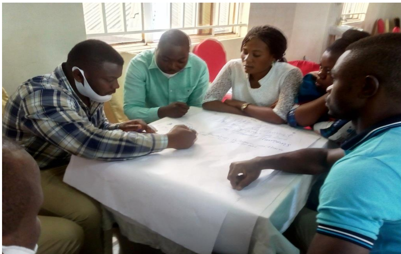
Les participants subdivisés en groupes discutent sur différents thèmes choisis

Il y a eu au cours de ces cinq jours de formation, une grande mobilisation de toutes les parties prenantes impliquées dans la défense et promotion des droits humains. Ceci s'est manifesté à travers les questions et réponses des participants mais aussi des travaux de carrefour pour lesquels les participants étaient appelés à faire.